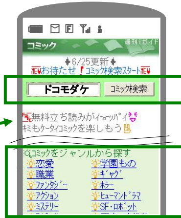
週刊ガイド「コミック」コーナー (6/30開始)