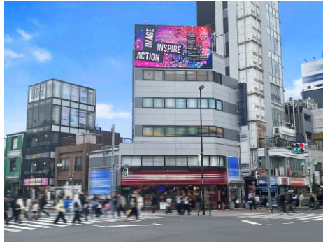
※新大久保アンニョンビジョン

今後「新大久保アンニョンビジョン」をはじめとし、さらなる屋外デジタル広告においてケシオンとの連携を全国規模で進めてまいります。